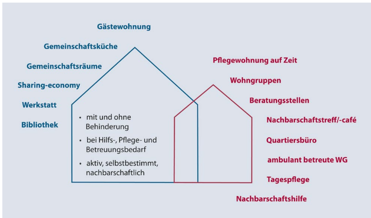
Abb. 1: Gemeinschaftliches Wohnen plus

realisiert wurden. Niedrigschwellige Unterstützungsangebote wurden beispielsweise durch die Öffnung ihrer Gemeinschaftsflächen für das umliegende Quartier, durch Integration eines Nachbarschaftscafés mit Mittagstischangebot in das Projekt oder durch den Aufbau eines Netzwerkes für ehrenamtliche/nachbarschaftliche Hilfen geschaffen. Die Bereitstellung weitergehender Angebote zur Betreuung und Pflege wurde durch Kooperationen mit professionellen Diensten realisiert. Entsprechende plus-Bausteine sind beispielsweise die Initiierung oder Integration von Wohngruppen für Menschen mit körperlichen und/oder kognitiven Beeinträchtigungen, Tagespflegeeinrichtungen, Pflegewohnungen auf Zeit oder ambulant betreute Wohngemeinschaften für Menschen mit Demenzerkrankung.