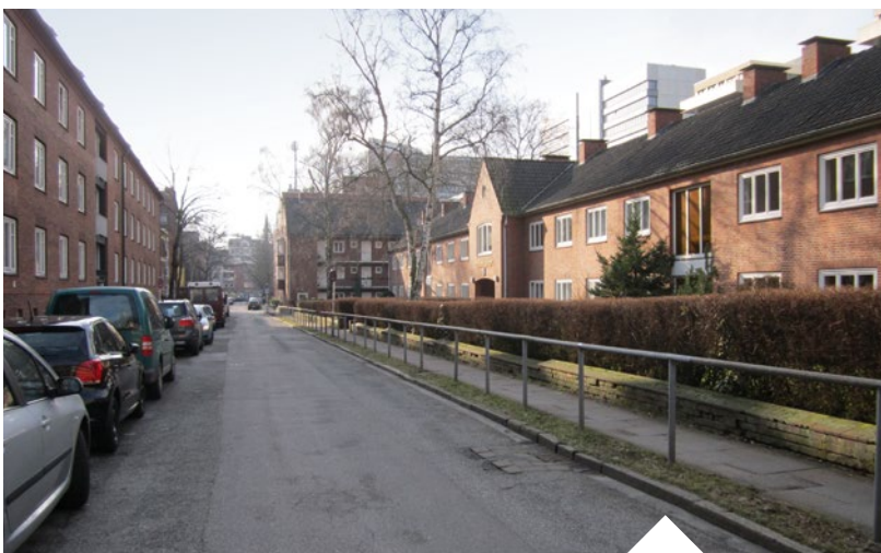
Die Seniorenwohnanlage der Hartwig Hesse Stiftung im Stadtteil St. Georg vor der „Erneuerung durch Ersatz“. An ihrer Stelle entstand das barrierefreie Hartwig-Hesse-Quartier (s. Foto S.21).

führen. Durch die schon oben beschriebene starke Bevölkerungszuwanderung ist aber auch dieses günstige Mietniveau in den letzten Jahren stark unter Druck geraten, was zu teilweise kräftigen Mietsteigerungen geführt hat. In der Folge können sich viele Menschen mit niedrigen oder mittleren Einkommen angemessenen Wohnraum in der Stadt nicht mehr leisten und werden verdrängt. Die Stadt versucht mit einem Ausbau und einer Ausdifferenzierung der verschiedenen Wohnungsbauförderprogramme in den letzten Jahren wohnungspolitisch gegenzusteuern. Neben dem normalen öffentlich geförderten Wohnungsbau (1. Förderweg) gibt es spezielle Förderprogramme für den Bau von Wohnungen für Studierende und Auszubildende oder auch für vordringlich wohnungssuchende Menschen (mit Dringlichkeitsschein). Weiterhin gibt es besondere Förderprogramme für Baugemeinschaften oder auch für Menschen mit Behinderungen oder Pflegebedarf (Förderprogramm Besondere Wohnformen). Neben diesen überwiegend auf den Neubau ausgerichteten Programmen gibt es auch spezielle Maßnahmen für den Bestand, wie zum Beispiel die Förderprogramme für Modernisierungen, oder auch für den Ankauf von Belegungsbindungen oder auch für rein energetische Sanierungsmaßnahmen.